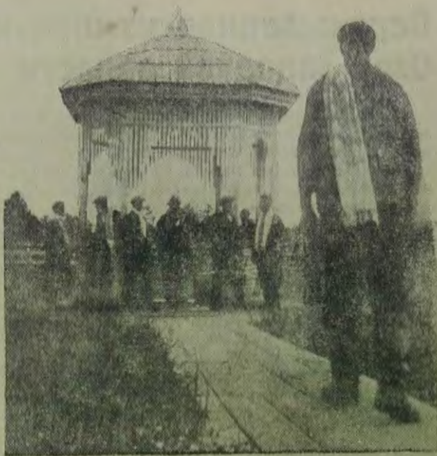
ЕваО. Кульдур. Источник молодости.

К сожалению, не все члены президиума, работающие по общественной нагрузке, осуществляют постановления III пленума Озет о том, что каждый из них обязан выполнять опреде-