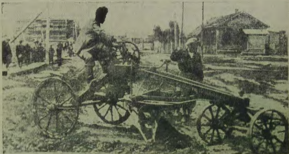
ЕвАО. Благоустривают гор. Биробиджан

Годовой план переселения 1934 года был намечен Биробиджанскими организациями в количестве 9000 человек.