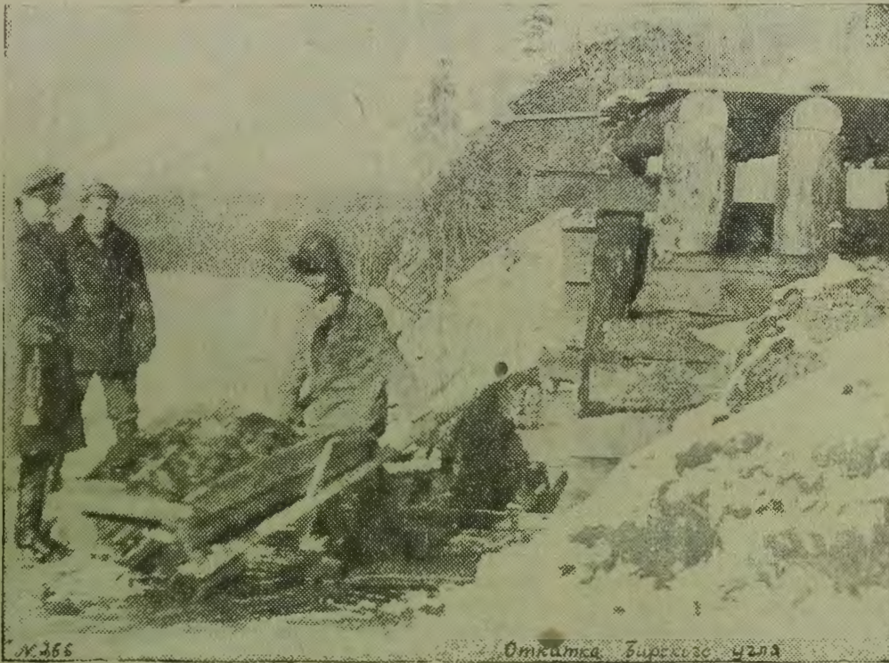
Ев.АО Откатка бирского угля