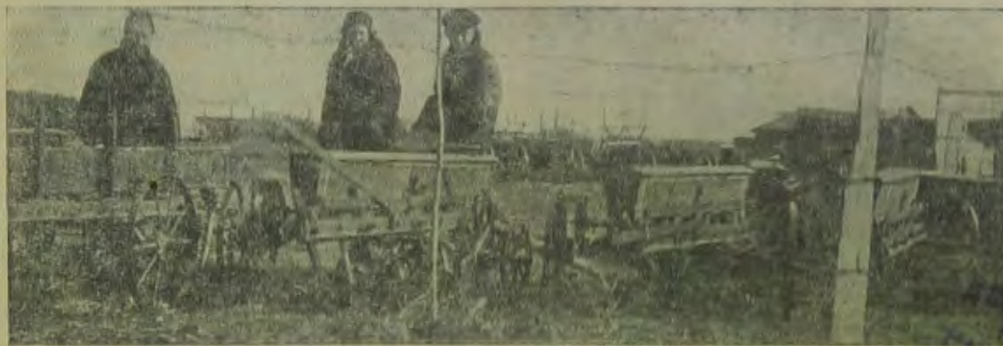
В евпаторийском районе.