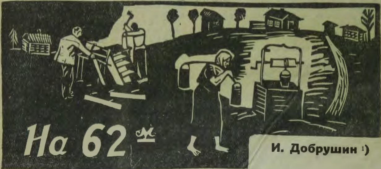
И. Добрушин 1)

Площадь в центре деревни. Колодец. Два еврея-крестьянина, орудуя топорами, строят что-то вроде трибуны. Появляется женщина с пустыми ведрами в руках.