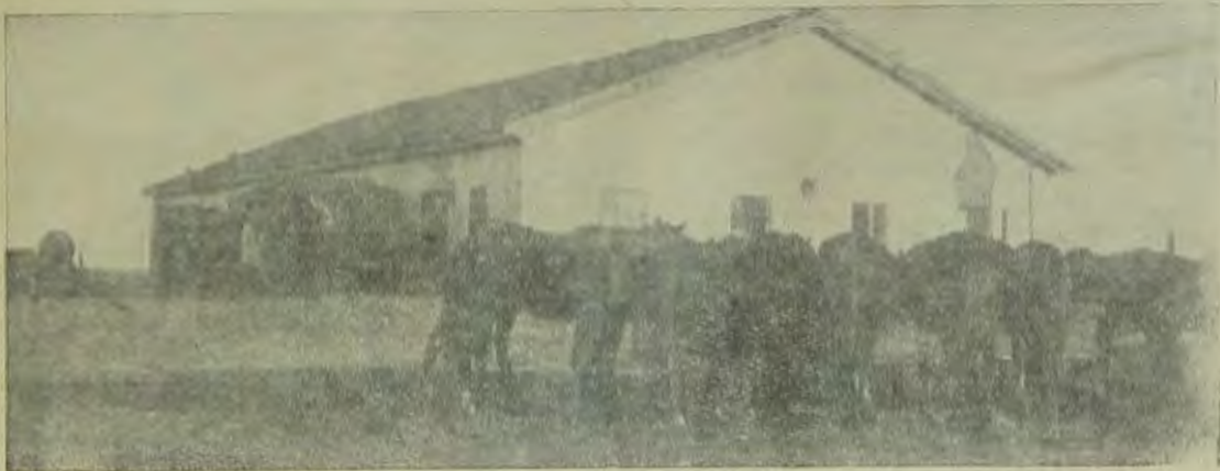
Поселон „Икор“ еваторийского района; Колхозные лошади в сохранившейся помещицкй конюшне.

Подвисоковский район переходит на сплошную коллективизацию. Местечко Покотилов, входящее в этот район, также коллективизируется. Кроме 75 крестьянских хозяйств, уже имеющих в местечке, выделяется еще земля для 140 еврейских семей. Таким образом, экономически местечко оздоравливается В фонд индустриализации собрано 300 подсвечников, 200 золотых вещей. Трудящиеся Покотилова вызывают Голованевск (Первомайского окр.) последовать их примеру.